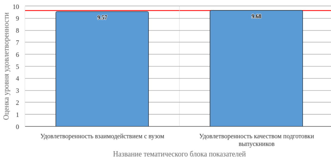
Рисунок 2.1 - Средняя оценка удовлетворенности (по тематическим блокам показателей)

Средняя оценка удовлетворенности респондентов по блоку вопросов «Удовлетворенность взаимодействием с вузом» равна 9.57, что является показателем высокого уровня удовлетворенности (75-100%).